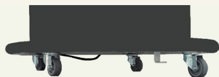
Vier Rollen mit Bremsen