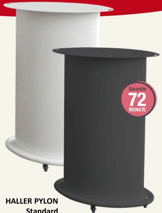
HALLER PYLON Standard

Stromkabel unter Aufbodenkanal 11 mm x 41 mm